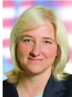
Justizministerin Eva Kühne-Hörmann