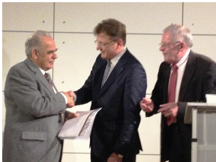
Jahresempfang der Stadt Ginsheim-Gustavsburg – Die Leseulen erhalten den Bürgerpreis