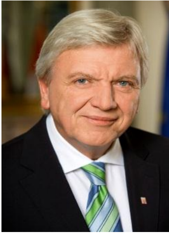
Ministerpräsident Volker Bouffier