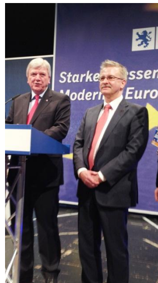
Unser Kandidat für Europa Michael Gahler gewählt auf Platz 2 der Landesliste