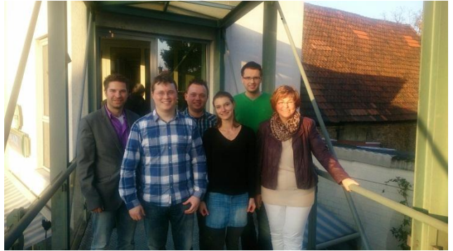
Mitgliederversammlung der Jungen Union Main Spitze