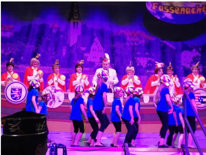
Närrischer Seniorennachmittag in Kelsterbach