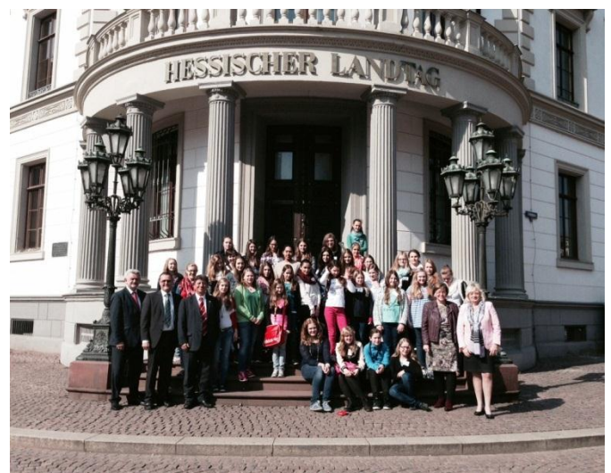
Girls' Day im Hessischen Landtag