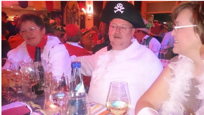
Schwarze 11 in Rüsselsheim mit Freunden aus dem Schwarzwald