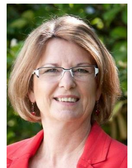
Umweltministerin Priska Hinz