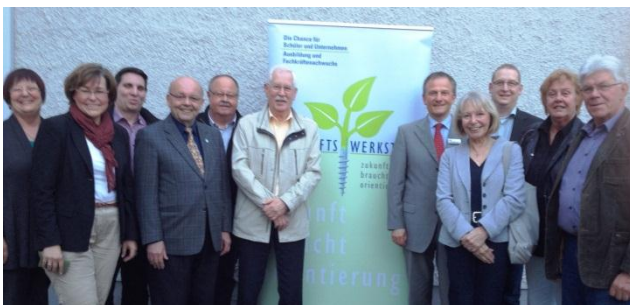
Besuch der Arbeitskreise Schule und Sozialpolitik der Kreistagsfraktion bei der IHK Darmstadt zur Information über die „Zukunftswerkstatt“