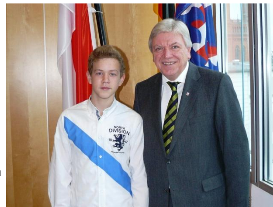
Mit dem Hessischen Minister- präsidenten Volker Bouffier