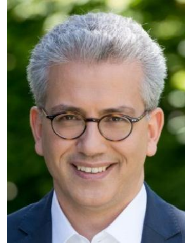
Stellv. Ministerpräsident und Minister für Wirtschaft, Verkehr, Energie und Landesentwicklung Tarek Al-Wazir