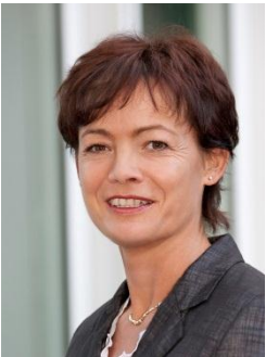
Ministerin für Bundes- und Europaangelegenheiten Lucia Puttrich