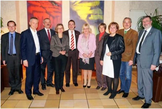
Klausurtagung des Arbeitskreises Schulpolitik