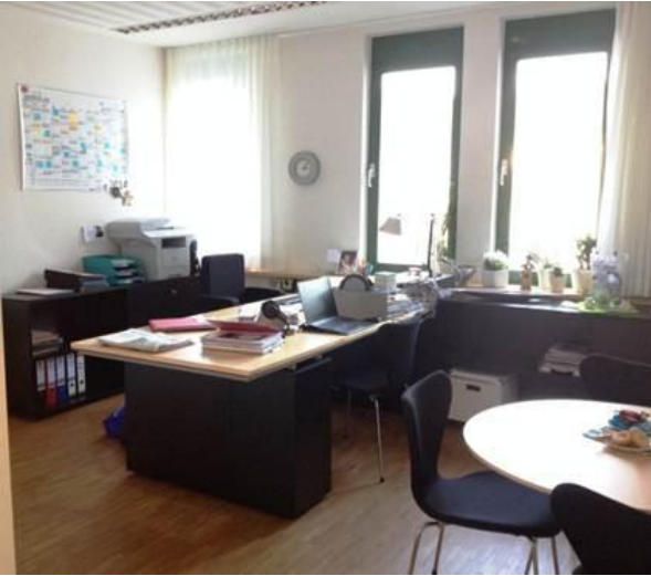
Neues Büro und alter Ausweis