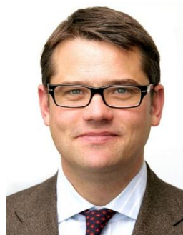
Minister für Wissenschaft und Kunst Boris Rhein