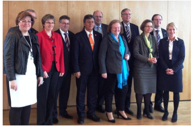
Der Arbeitskreis Sozialpolitik der Landtagsfraktion