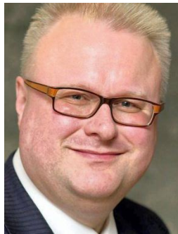
Finanzminister Dr. Thomas Schäfer