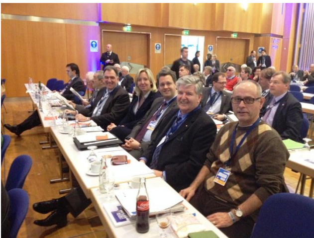
Unsere Groß-Gerauer Delegierten beim Landesparteitag zur Wahl der Europaliste