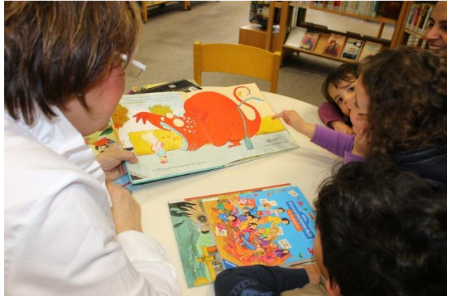
Vorlesetag in der Stadtbücherei Rüsselsheim