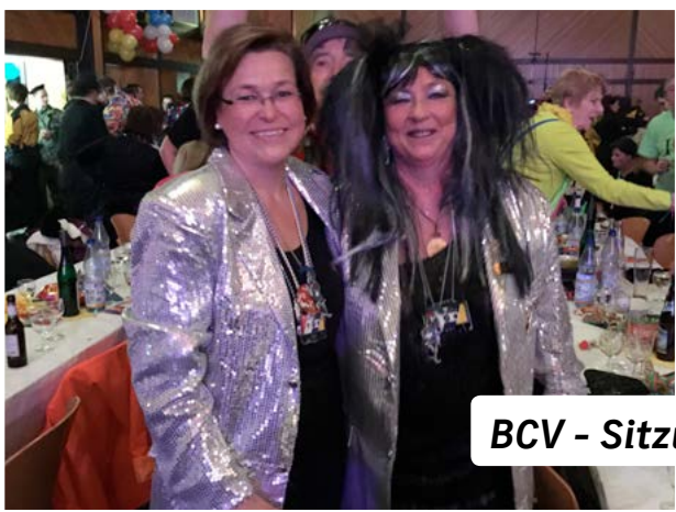
BCV - Sitzung