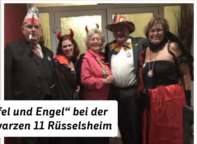
„Teufel und Engel“ bei der Schwarzen 11 Rüsselsheim