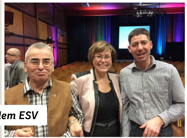
Bei dem ESV